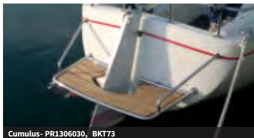
Cumulus- PR1306030, BKT73