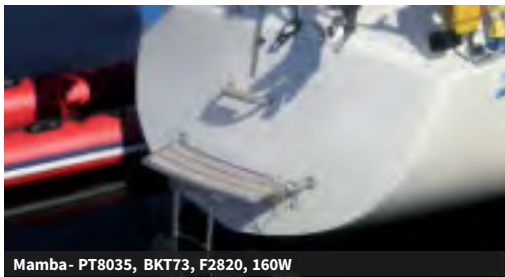
Mamba - PT8035, BKT73, F2820, 160W