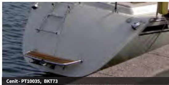
Cenit - PT10035, BKT73