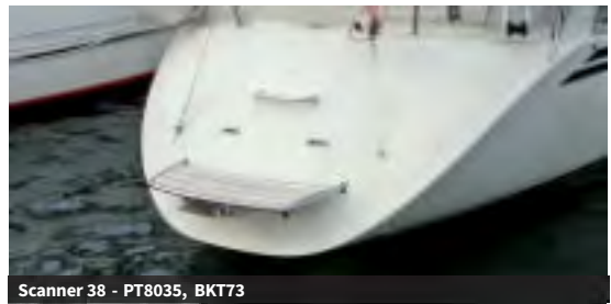
Scanner 38 - PT8035, BKT73