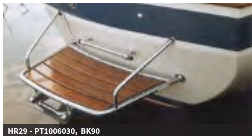
HR29 - PT1006030, BK90